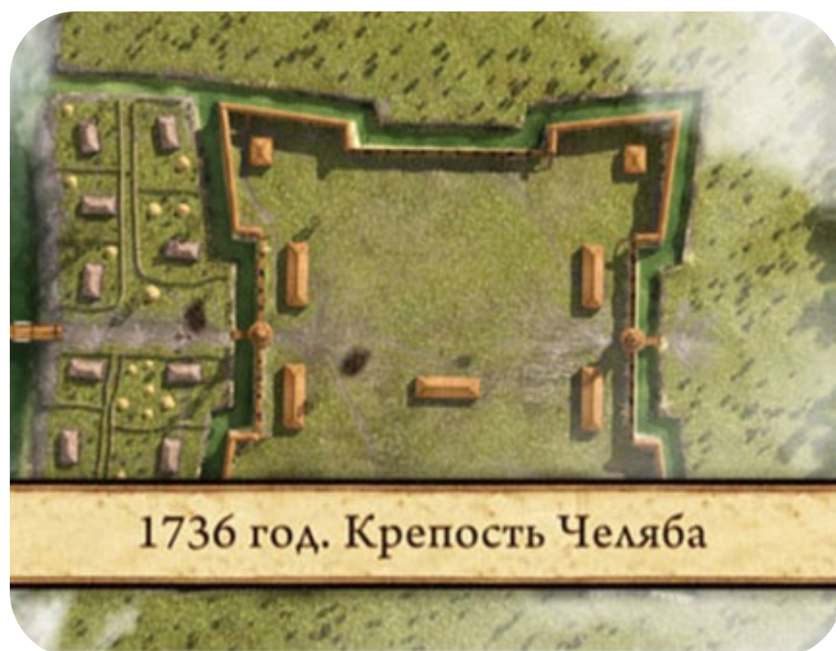
1736 год. Крепость Челябин

Военный врач, штаб-лекарь, изучавший инфекционное заболевание «Сибирская язва». Родился в 1760 г. в Черниговской губернии в местечке Салтыкова-Девица в семье приходского священника.